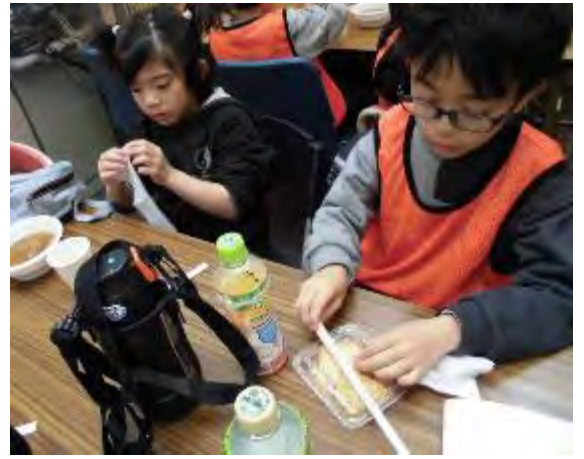
もちつき大会に参加しました★