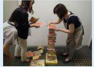
大きなキャプテン・リノ