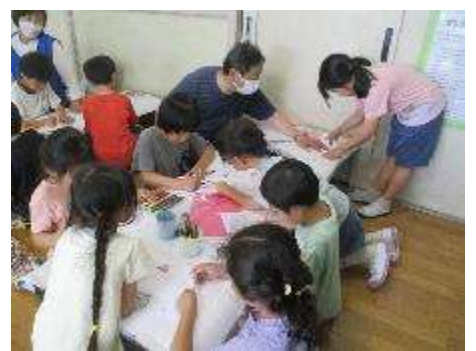
「工作の日～うちわづくり～」事前に準備した絵柄だけでなく、今年はオリジナルイラストの作品が多数見られました。使ってみてね