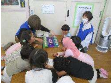
「マンカラのやり方をおぼえよう！」 「かんたんだよ!」「だいじょうぶだよ!」