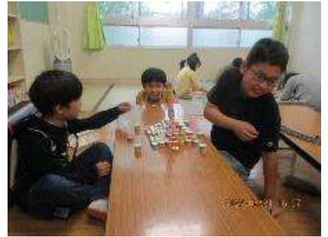
こちらのグループでは、ペットボトルキャップを積んで、その高さを楽しんでいました。