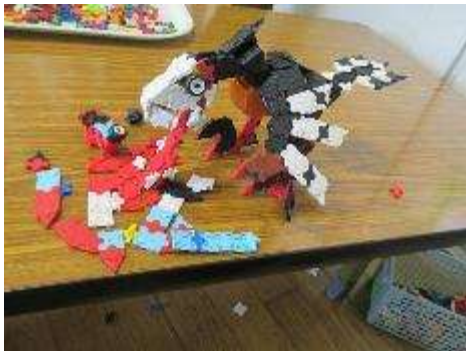
LAQ ブロックで毎日見事な作品が作られています。