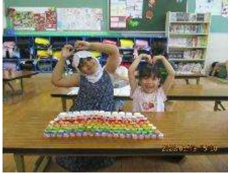
わくわくでは、ペットボトルキャップが おもちゃです。きれいな壁ができました。