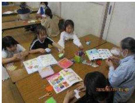
「おりがみの日」久しぶりのおりがみ遊びでは、集中して作品を作っていました。