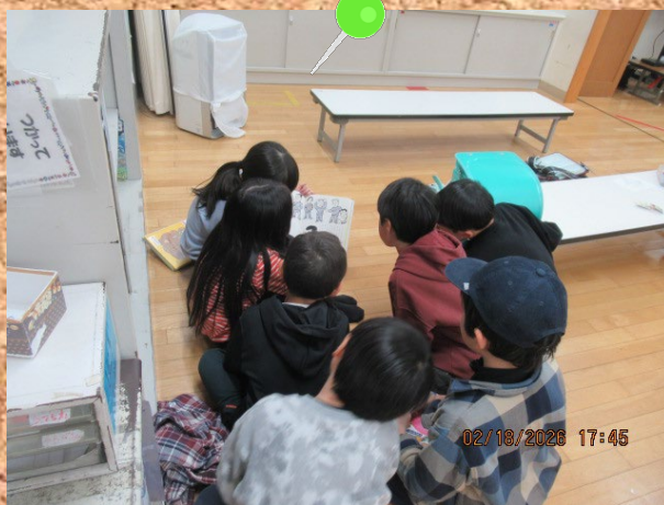
学習タイムに読み聞かせを してくれる子たちがいました！