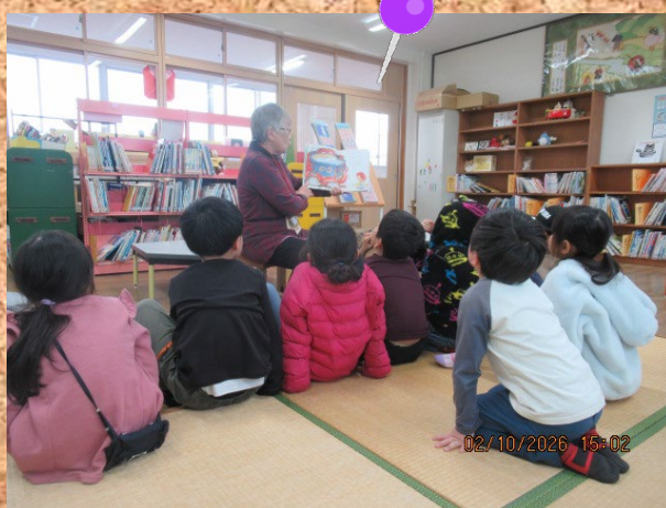
今月の「おはなし広場」も大人気～