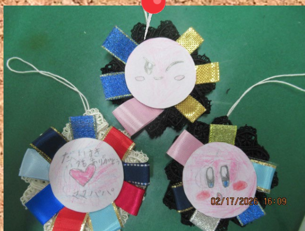
ステキな口ゼットができました★