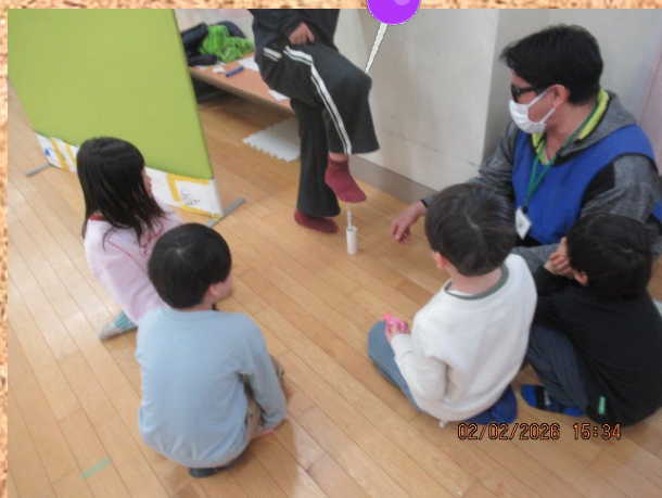
みんなで「こんちゃれ」に挑戦★