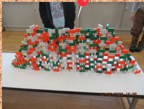
ブロックを全部使って、上手に 積み上げました♪