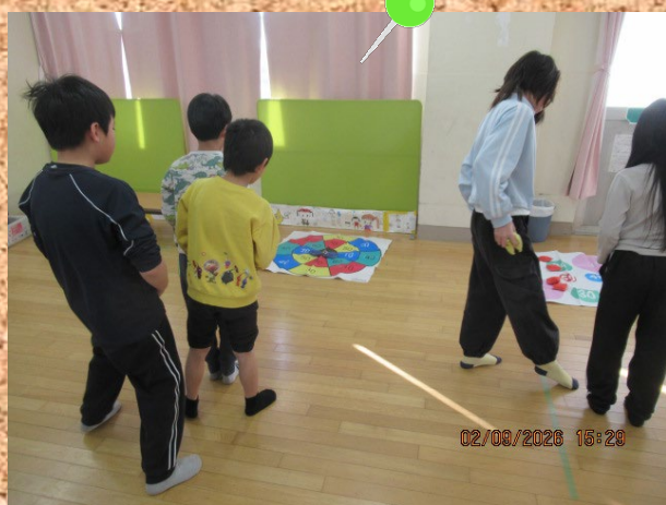
外遊びができない日は、 室内でボール遊び！