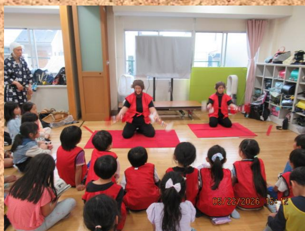
「銭太鼓」も披露してくださいました 華麗な技に、みんなびっくり！