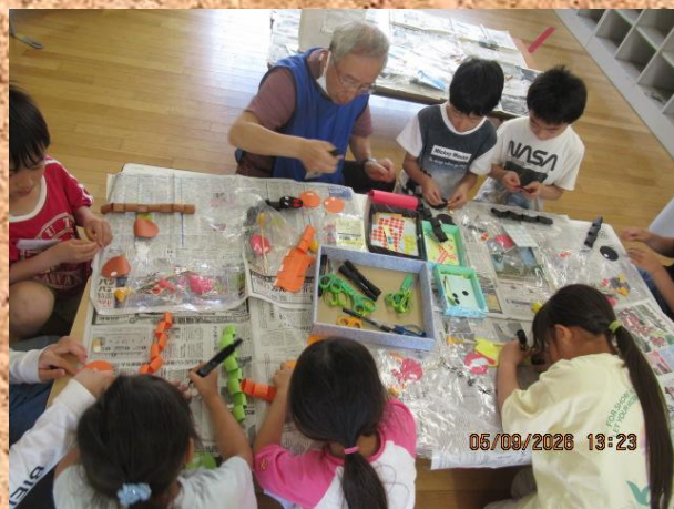
土曜日の工作は大人気！