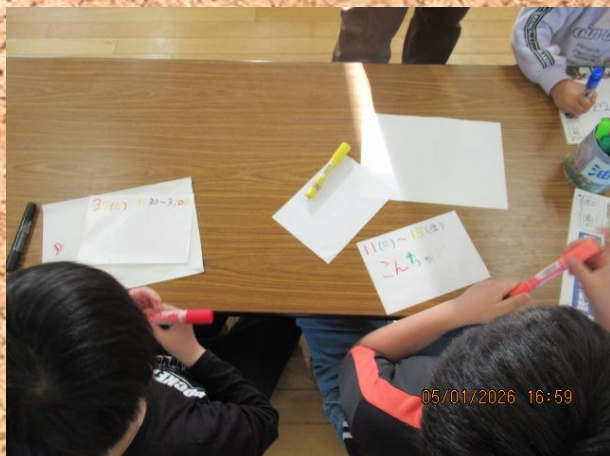
いつも行事予定ポップを 作ってくれてありがとう♪