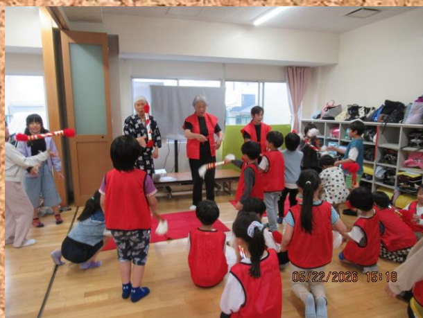
体験もできました☆

「わくわくカレンダープロジェクト」 「ホットケーキをつくろう」の様子は 6月プラザ室に掲示します♪