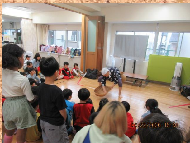
安来節保存会の方々が来てくださいました はじめての「どじょうすくい」に興味津々