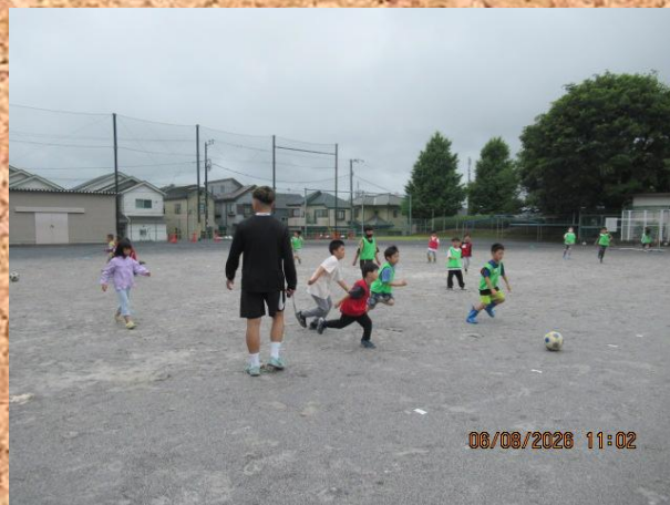
みんな全力でボールを追いかけてました！