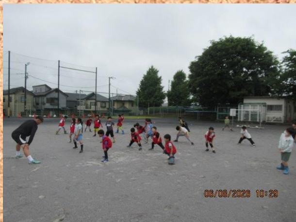
雨上がりの「サッカー教室」