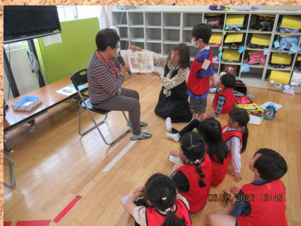
今月の「おはなし広場」も楽しかったね