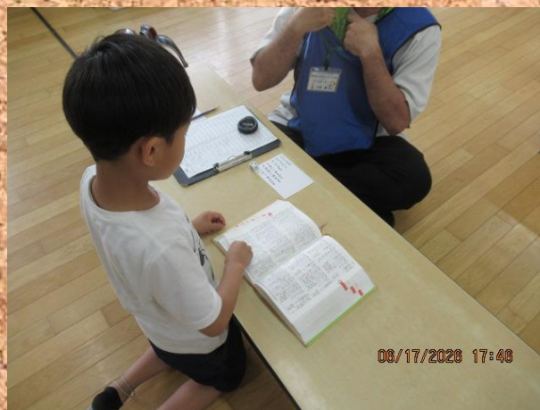
「こんちゃれ」にチャレンジ中～