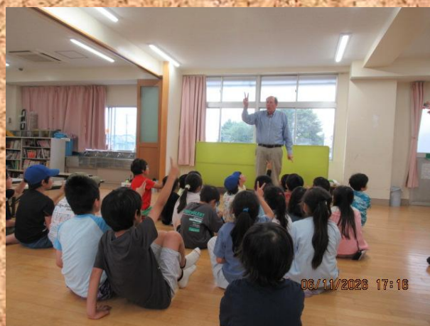
「英会話教室」は英語オンリー（！）でしたが、みんな積極的に取り組んでいました