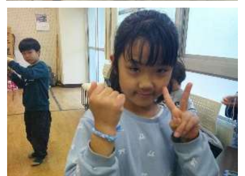
【工作：いろいろな色の紐ひもプレスレットを作りました。ハイポーズ!】