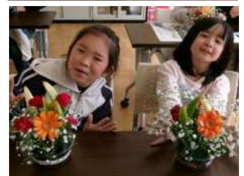
【フラワーアレンジメント教室（保護者参観）：子どもたちは自由にフラワーアレンジメントを作り、楽しみました】