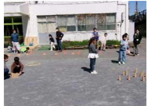
【保護者懇談会：懇談会の後、写真展を観て、命の読み聞かせを聞いて、最後に親子でモルックを楽しみました】