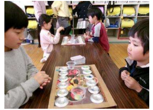
【絵本の読み聞かせをしました】 【今年度のマンカラチャンピオンが決定しました。左から銅・金・銀の各メダリストです】