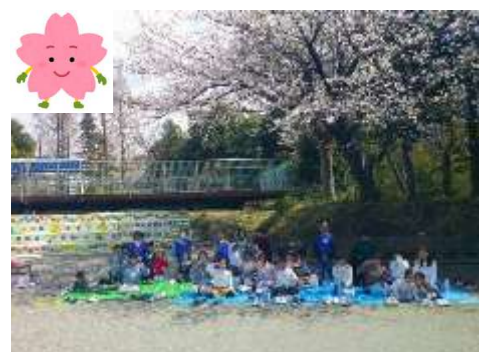
【雨降りの日に多目的室でねずみたたきゲームを楽しみました】 【仲良しです】 【お花見をしました。1年間ありがとうございました】