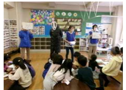
【リアルなそとときゲーム：顔なしに食べられたリーダーを、子どもたちが4つの謎を聞いて取り戻してくれました】