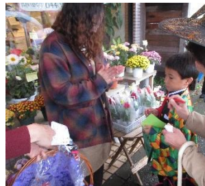
フラワーショップまきば