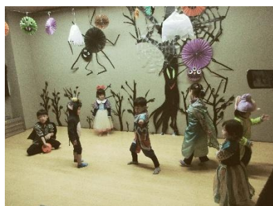
いこいの家大広間の舞台

ハロウィンパレードは、気温が下がり始めたあいにくの雨でした。お気に入りの衣装を身にまとった小学生、保護者の皆さんと初めて長い距離を頑張って歩く乳幼児親子の姿がありました。協力いただいた「フラワーショップまきば」ではステキなお花をいただき、「リリエンベルグ」ではカボチャ型のクッキー、「麻生いこいの家」では事前にこども文化センターの子どもたちも作成したハロウィンの折り紙の飾り、「山口台自治会」では、お菓子をいただきました。それぞれの場所で暖かい言葉があり、地域の子どもたちのためにサポートしてくださる大人がたくさんいてくれたことで、子どもたちの笑顔を見ることができました。