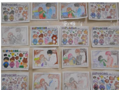
今月のぬり絵大賞