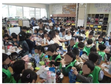
4月7日昼食時の様子です