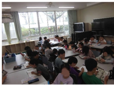
フォーメーションB!の時の特別活動室です

今年度4月1日の利用人数は125人！ 4月中の最大人数は143人でした。 昨年度を大きく上回る利用人数の日が続きました。 全学年一斉に下校してくる日は3～6年生がプラザ室ではなく特別活動室活動に入る（フォーメーションB!と呼んでいます）などみんな協力して日々活動しています。