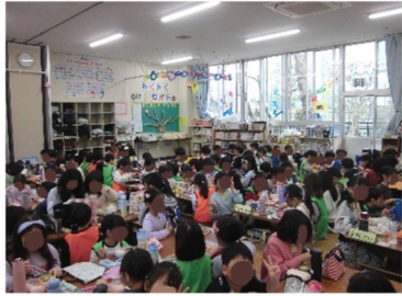
4月1日昼食時の様子です