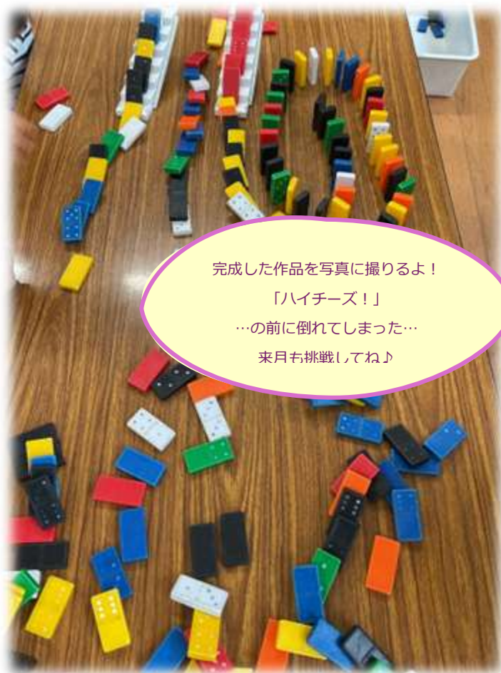
完成した作品を写真に撮るよ！ 「ハイチーズ！」 …の前に倒れてしまった… 来月も挑戦してね♪