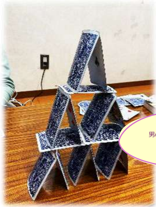
男の子も女の子も組み立てて 遊ぶのが大好き★