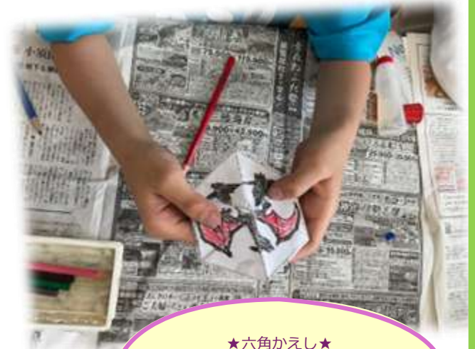
★六角かえし★ 人気キャラクターの六角かえ しにはまる子続出！