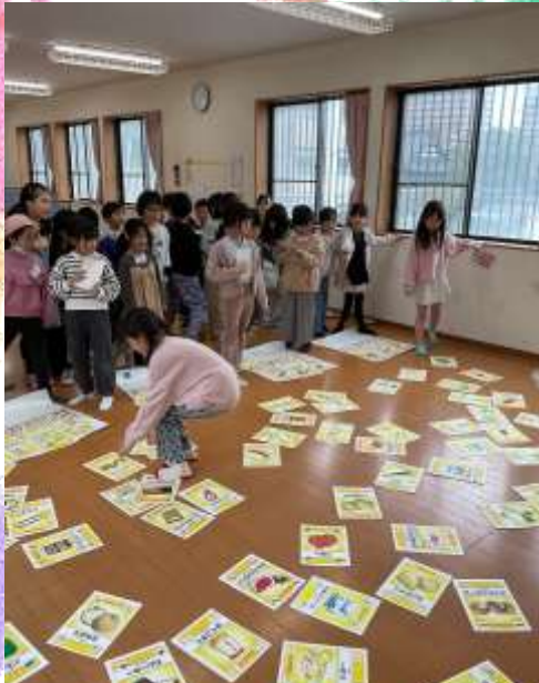
巨大レシピで遊びました。いつものレシピとルールが違うので戸惑いもありましたが、楽しみました！