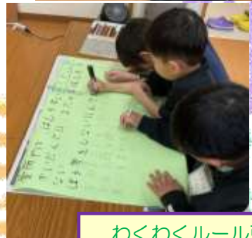
わくわくルール更新中！