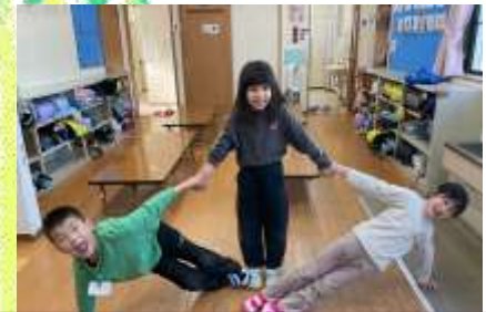
組体操？ 元気があまっています！