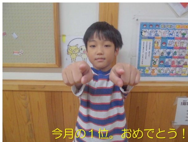
今月の1位。おめでとう！