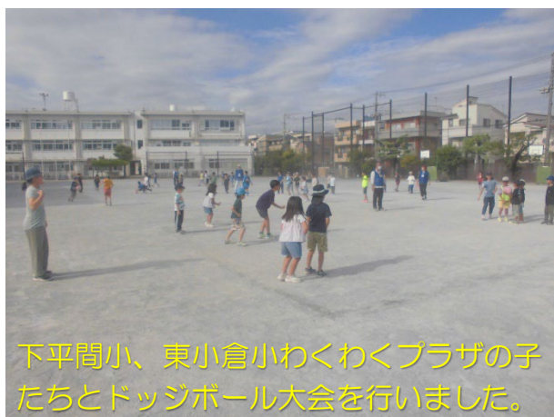
下平間小、東小倉小わくわくプラザの子 たちとドッジボール大会を行いました。