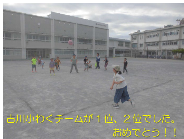
古川小わくチームが1位、2位でした。 おめでとう！！