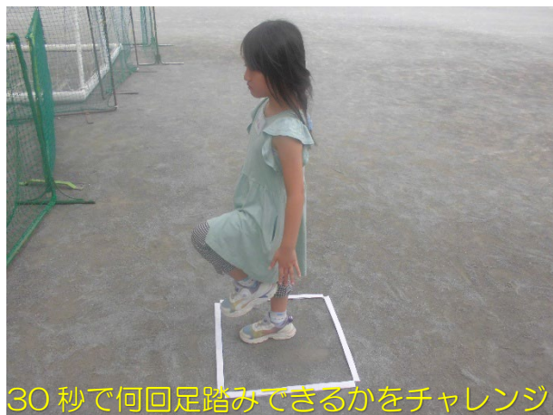
30秒で何回足踏みできるかをチャレンジ