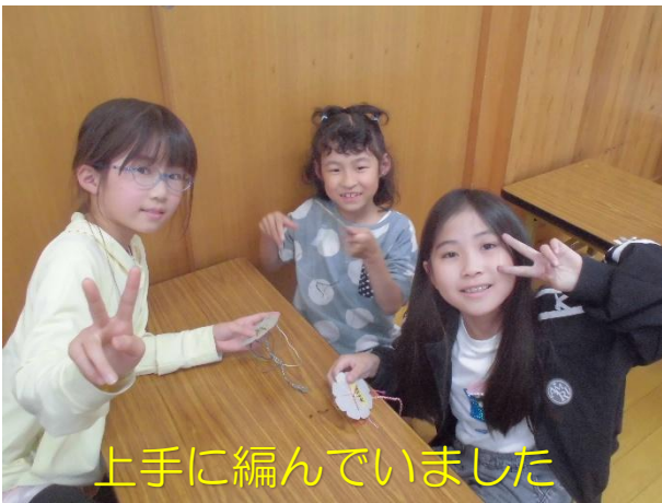
上手に編んでいました