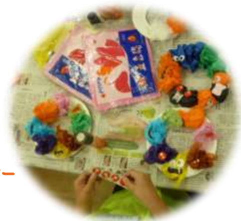
モンスターリース

10月はハロウィンをテーマに工作を3回行いました。ばくばく工作・モンスターリース・モンスターボックスを製作しました。