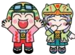
こぶんた わくりん

ご入園・ご入学・ご進級おめでとうございます！ しょうがく1ねんせいになったら子どもたちだけで こぶんにきてあそべるよ！ おうちのひとにつながるでんわばんごうをかけるようにしてね！