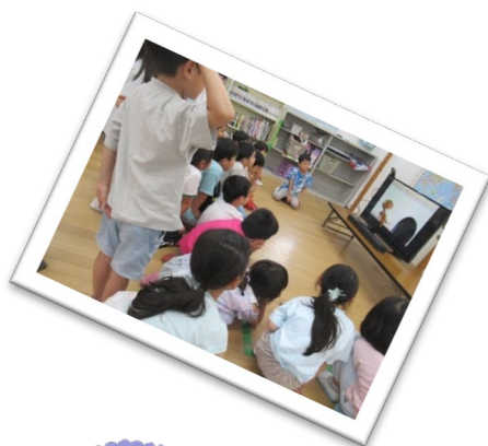
平間小わくわくプラザ 活動の様子

※7月1日(水)は 8:00 開室です。お昼をまたいで利用する際はお弁当を用意してください。