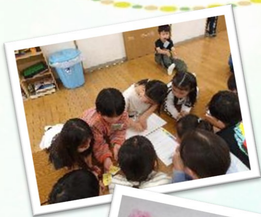
こどもリーダー会議