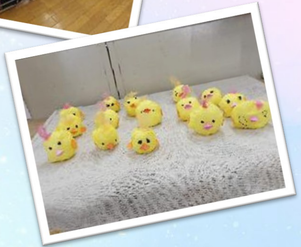
ちょっと遅れてサプライズ! 新一年生歓迎会