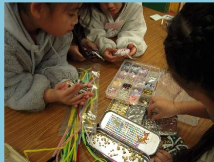
どのシールを貼ろうかな