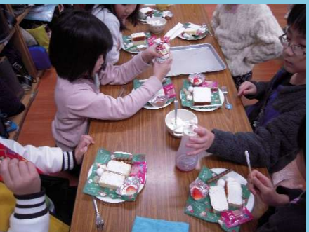
今日はパティシエ気分 おいしく楽しくいただきました