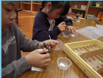
思い思いに貼りつけて…