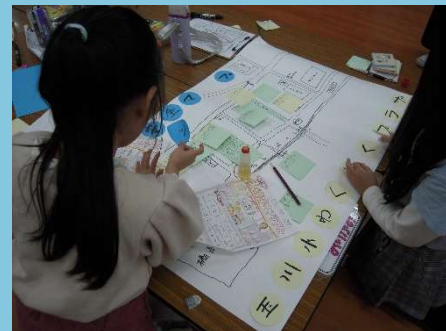
結果をみんなでまとめました。