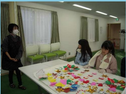
いこいの家に壁面をプレゼント。