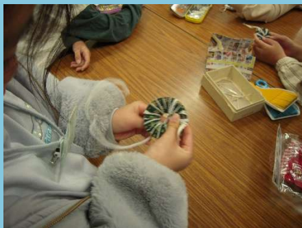
選んだ布を巻いていきます。