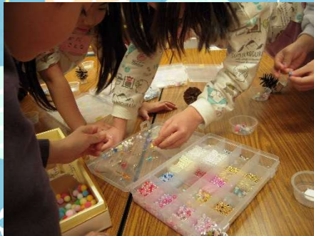
パーツ選択中。迷うよね～。