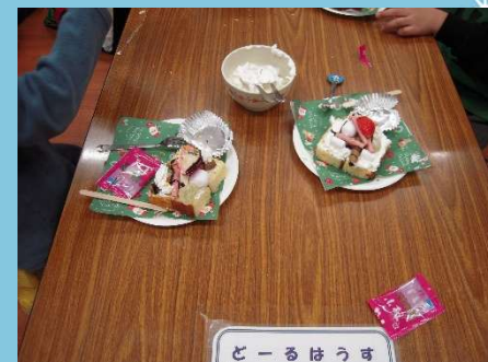
おいしいケーキのできあがり！