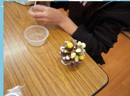
素敵なツリーの完成！