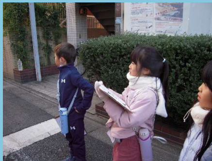
安全かな？よく観察して。