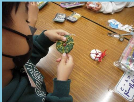
モールでおめかし。