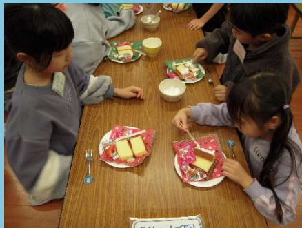
クリームを塗って・・・