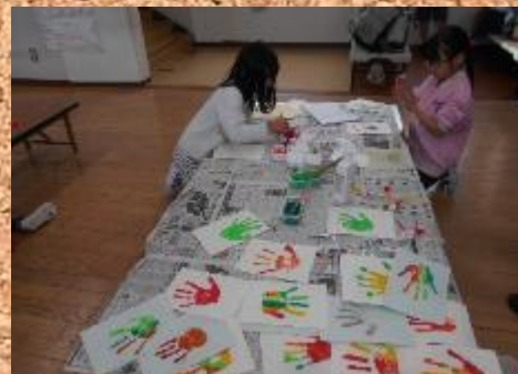
壁面工作(手形紅葉～)