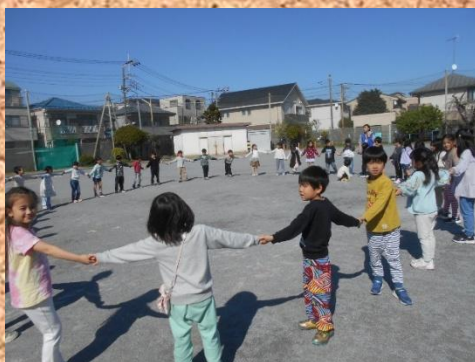
1年生みんなで遊んだよ!