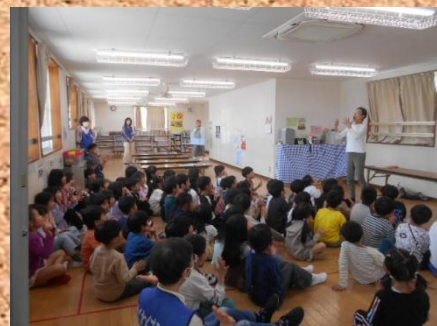
読み聞かせ おはなしもり