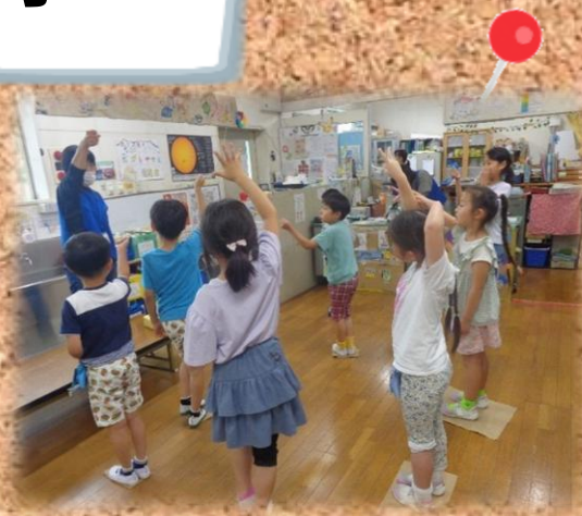
みんなで遊ぼう 台風の日にお部屋の中で 遊びました。