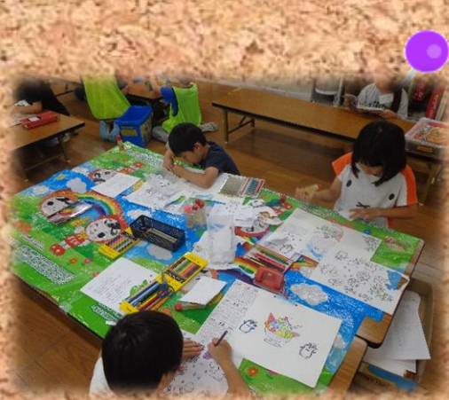
オリジナルカレンダー作り