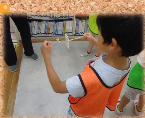
木月クラフト ぶんぶんこま作りをしました。