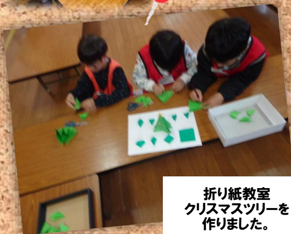
折り紙教室 クリスマスツリーを 作りました。