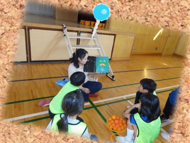
からだで学ぶ★キッズ英語