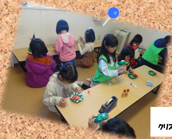
木月クラフト クリスマスリースを作りました。