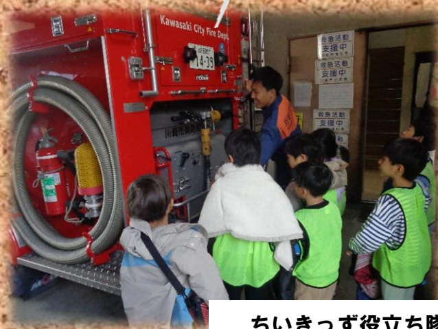
ちいきっず役立ち隊～ありがとうを伝えよう 中原消防署荻宿出張所へ行ってきました。