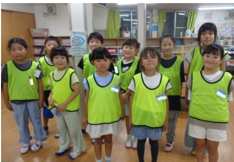
2026年度こどもリーダーのメンバーです！ 1年間がんばります！応援してね！