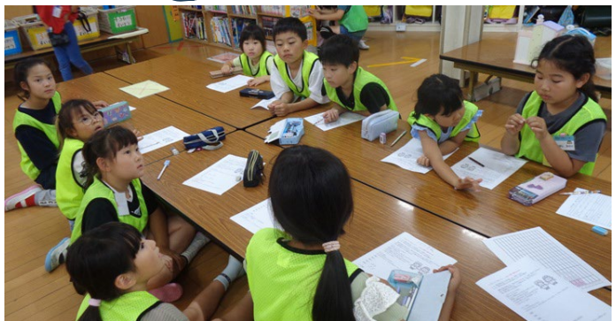
第1回のこどもリーダー会議の様子です