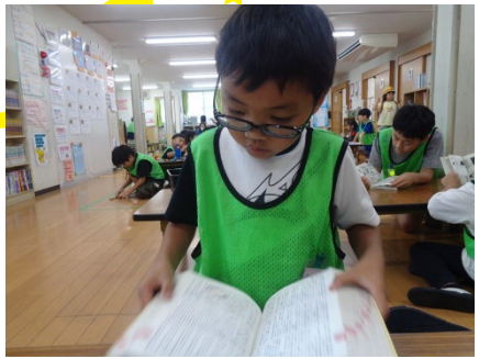
「こんちゃれ」(今月のチャレンジ)の日です この日は高速めぐ