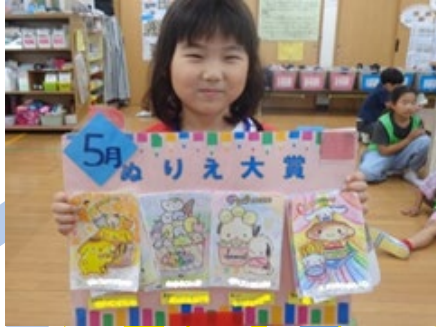
5月の「ぬり絵大賞」は優秀な作品が多く、4人が選ばれました