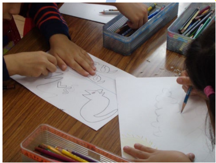
「お絵かきクラブ」の日です 毎月のテーマに合わせて、みんなでお絵かきをしています