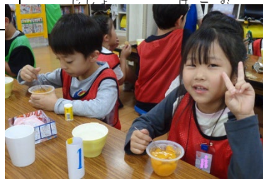
わくわくおやつ・みかんゼリー