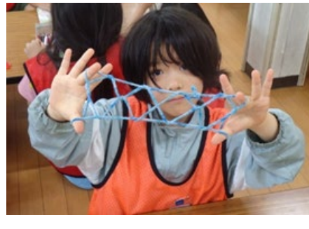
こちらは自由時間の写真です あやとりがじょうずな子もいます 4段ばしごができました！