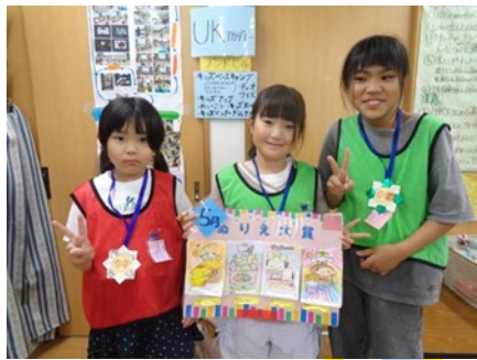
5月の「ぬり絵大賞」の賞にえられた子たちです！おめでとう！