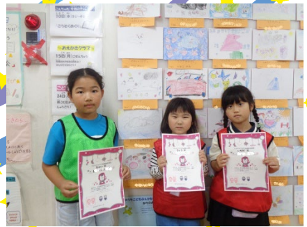
「お絵かきクラブ」もそれぞれ賞があるので、毎月表彰式があります！1年生も参加をしています！