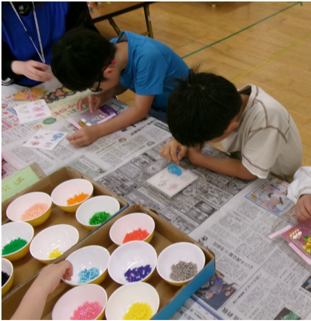
SDGs エコ工作【アクアビーズ】