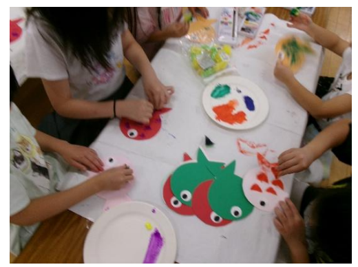
ぬりえイラスト大賞