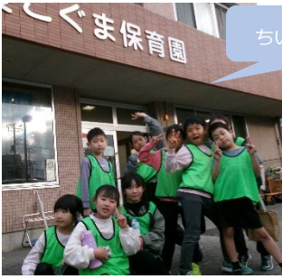
ちいキッズ役立ち隊