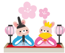
めりえイラスト大賞