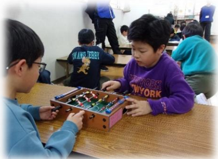
みんなの意見でおもちゃを買いました♪