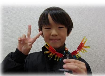
ミニブロックとても上手に作ります！