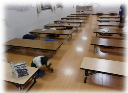
避難訓練、みんなとても上手です！

◎個人情報保護・犯罪被害防止の観点から、原則として、行事や施設内で撮影した写真や動画は、インターネット上（SNS・ブログ・ホームページ等）へ公開しないでください。こども文化センター及び、わくわくプラザに関わるご意見・ご相談等は、末長こども文化センター（044-877-5540）、新作小学校わくわくプラザ（044-857-4120）、又は公益財団法人かわさき市民活動センター青少年事業課（044-430-5603）までお寄せください。なお、お問い合わせ内容の正確な把握とサービス向上のために、通話の内容を録音する場合がございます。予めご了承ください。