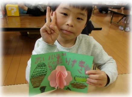
毎月工作をしています♪