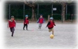
サッカーも大人気♪