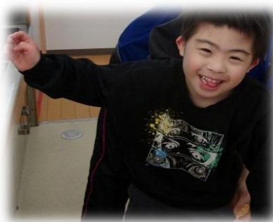
いつもニコニコです♪