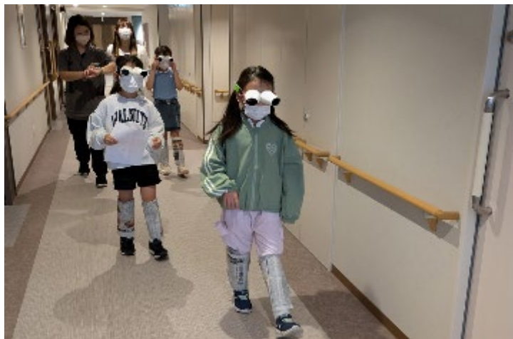
こども食堂へ行こう! 5月10日(土) 10:30~14:00 5名 今回はラヴィーレ元住吉へ行って利用者へのご飯の配膳と、視界が見えなくなる眼鏡をして関節がまがりづらくなるように新聞紙を巻いて歩くなどの高齢者体験をしました。