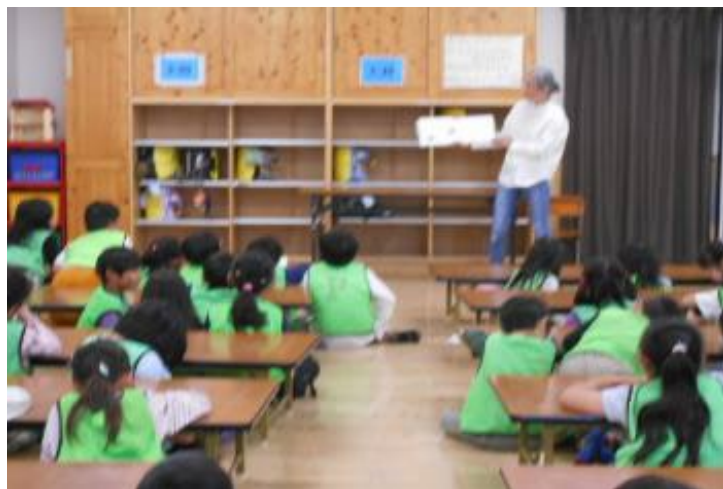
絵本の読み聞かせ 5月8日(木) 13:40~14:10 44名 読み聞かせボランティアのどんぐりさんが1年生向けに絵本を3冊読んでくださいました。