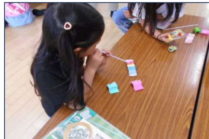
チョコキペタ工作 5月26日(月) 10:00~10:40 20名 あおむしにやさしくストローで風をあてて動きを楽しみました!