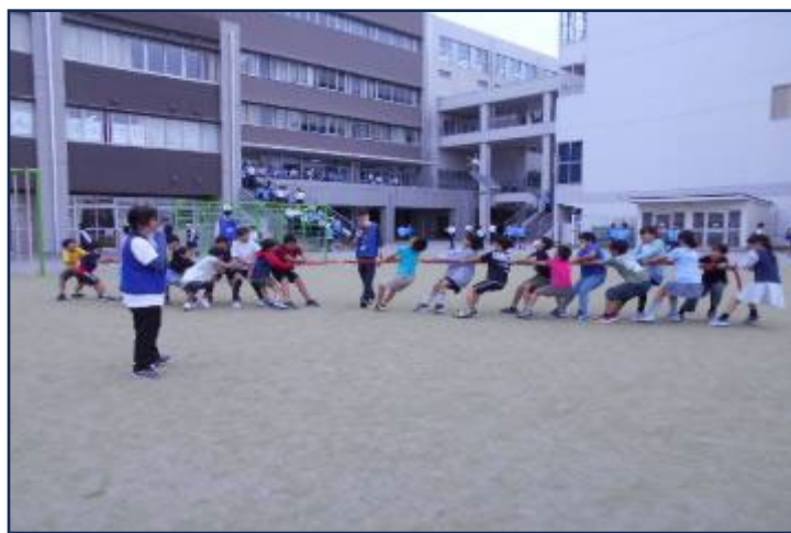
わくわく大会 5月22日(木) 15:00~15:30 150名 今回は学年別にわかれて綱引きをしました。1年生は初めてのわくわく大会で楽しんでいました。