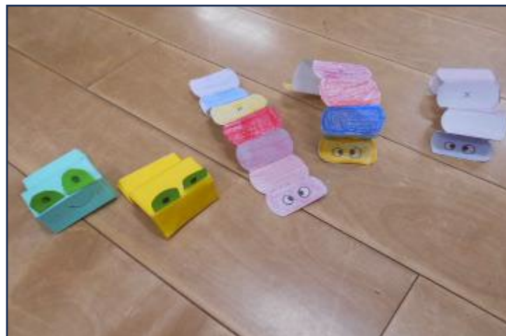
チョコキペタ工作 5月26日(月) 10:00~10:40 20名 おりがみをつかってピョンと飛ぶかえると、尺取虫のようなおもしろい動きをするあおむしを作りました。