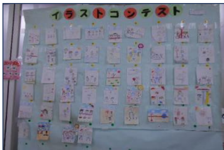
イラストコンテスト 5月12日(月)~16日(金) 24名 今月のテーマは「運動会」楽しそうにリレーや玉入れをしている子どもたちのイラストが集まりました。