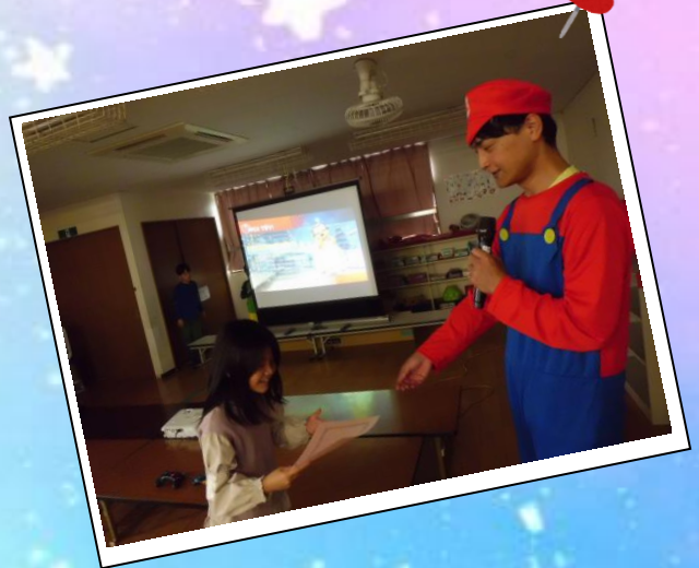
ふれあいコンサート