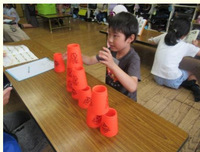
# 生-1 グランプリ「カップスタックス」