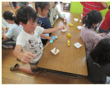
# サイエンス工作「ブンブンごま」