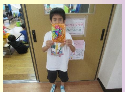
# 生-1 グランプリ「カップスタックス」