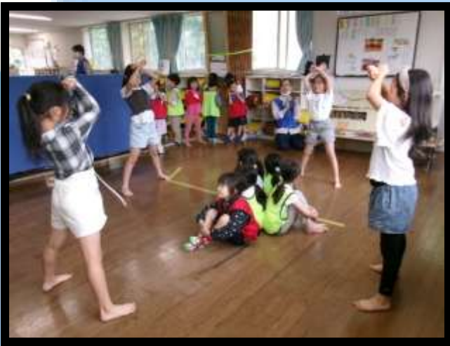
【ロックソーラン隊】

今回は絆メンバーの練習の様子をお届け！ 真ん中で見ている一年生もとても楽しそうです