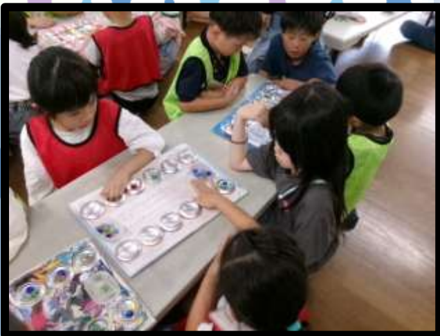
【みんなであそぼう】

こどもリーダーが審判になって試合を見守りました。これでマンカラのルールはばっちりですね